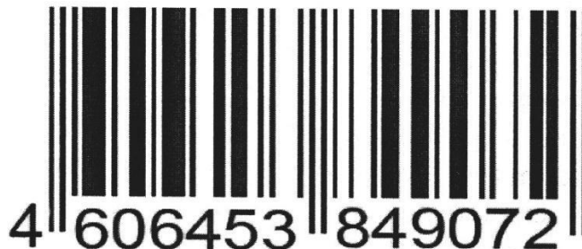
Рисунок 1 – Штрих код

Определение подлинности товара по штрих-коду международного стандарта