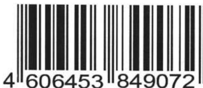
Рисунок 1 – Штрих код

Определение подлинности товара по штрих-коду международного стандарта